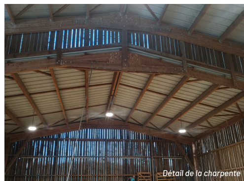
Détail de la charpente

Début des travaux / fin : octobre 2019 à février 2020