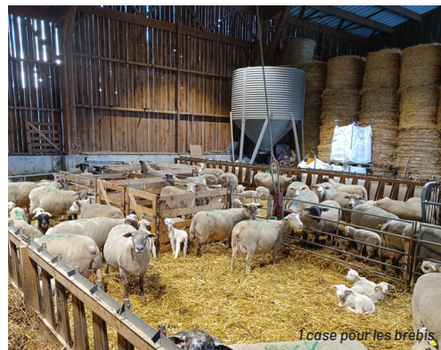
Case pour les brebis