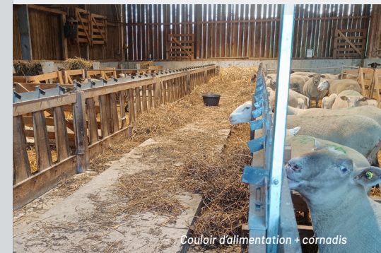
Couloir d'alimentation + cornadis